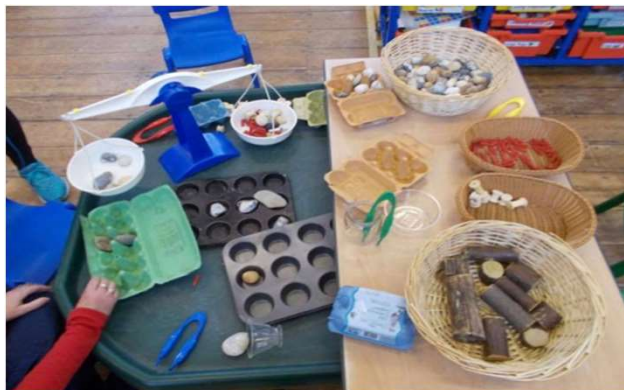
Experimentální, tvořivý, rozvoj fantazie