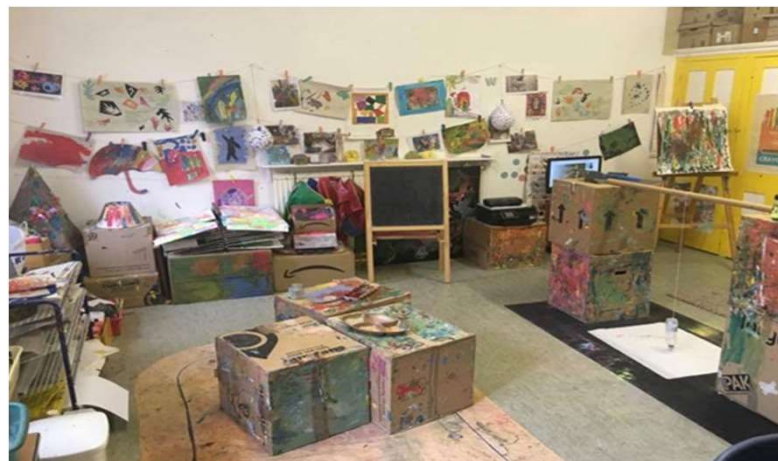
Výtvarná místnost, v době stáže zde probíhal komunitní kruh a lekce mindfulness pro děti