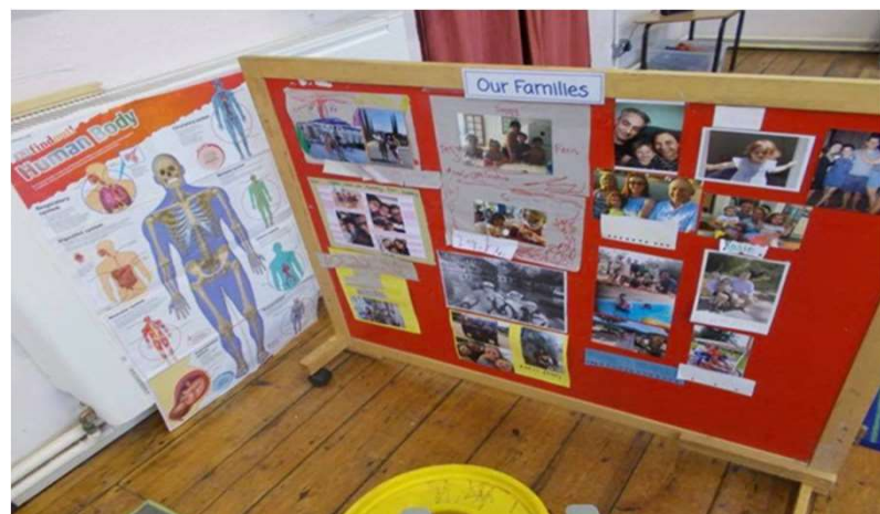
Rodinný koutek“, děti zde mají na fotkách obrázky svých rodin. Do výuky je rovněž zařazená prezentace země ze které dítě s OMJ pochází. Prezentuje rodič dítěte.